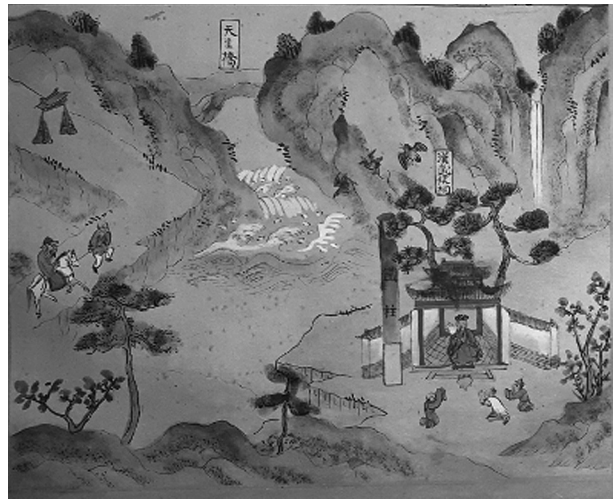
Картина к описанию области Чжао-чжоу с изображением храма Ханьского князя У-хоу (Чжугэ Ляна) 漢武侯祠 и железного столба

и затем отпускал 4 . Так, в начале описания округа Шуньнин-фу (順寧府, № 13) сказано: «Данный округ – это земля варваров пу-ман 浦蠻, с Мэн Ху имеют родство. С тех пор как Чжугэ [Лян] У-хоу арестовал и отпустил его, до Пяти династий и Сун [оставались] все такими же дерзкими, своевольными и глупыми», на карте округа отмечен храм князю У-хоу (Ухоуцы 武侯祠). В описании уезда Илян-сянь (宜良縣, № 29) также упомянуто, что народ гого (в настоящее время называется ицзу) ведет свой род от Мэн Ху. В описании области Чжао-чжоу (趙州, № 14) сказано о роли Чжугэ Ляна в развитии региона: «Во время похода Чжугэ, князя У-хоу, народ восхищался только его походом на Байянь 5 . Добродетель У-хоу в том, что вошел в горные леса и заложил улочки городского поселения... Железный столб в ста ли от управы области. У-хоу захватил Мэн Ху, установил железный столб как память о подвиге, местные часто подносят ему жертвы». Исследование Р. вон Глена упоминает легенду о том, что «Чжугэ Лян и Ма Юань [помогавший ему генерал] обозначили свою победу над народами юга путем возведения бронзовых столбов для обозначения границ ханьских земель, они также устанавливали бронзовые столбы, быков и барабаны над реками завоеванных территорий для умиротворения водных божеств-рептилий, управлявших стратегическими водными переправами» [Glahn von, 1987, p.15]. На карте области Чжао-чжоу изображен храм в честь Ханьского князя У-хоу 漢武侯祠 с желез